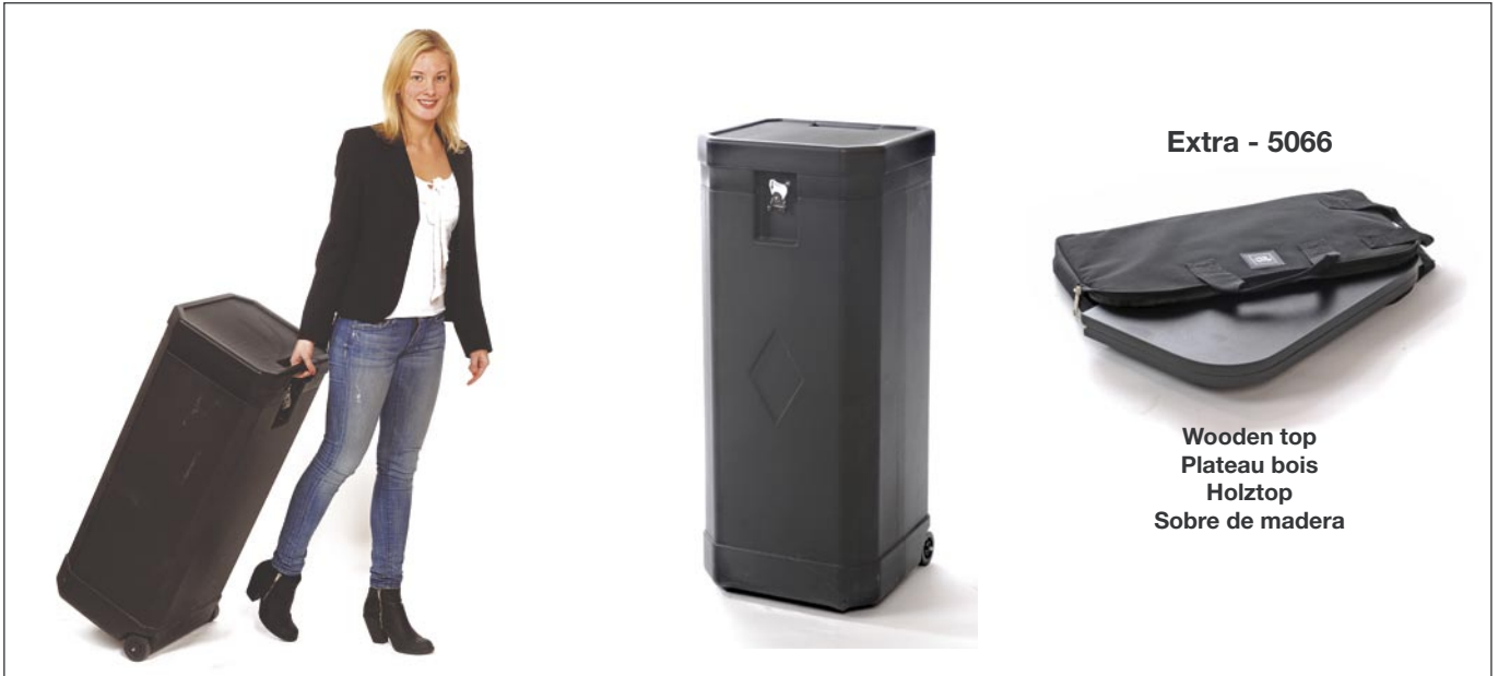
Extra - 5066

Instructions de montage – Aufbau-Anleitung – Instrucciones de montaje